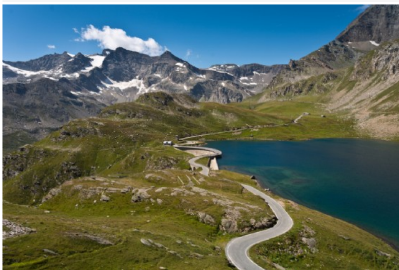
A Ceresole Reale il Gran Paradiso Film Festival

Consiglia Condividi Consiglia questo elemento prima di tutti i tuoi amici.